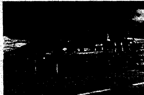
Vedere laterala proprietate