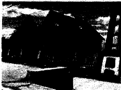
Vedere laterala proprietate