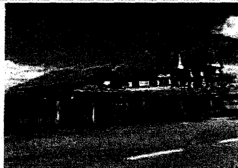
Vedere laterala proprietate