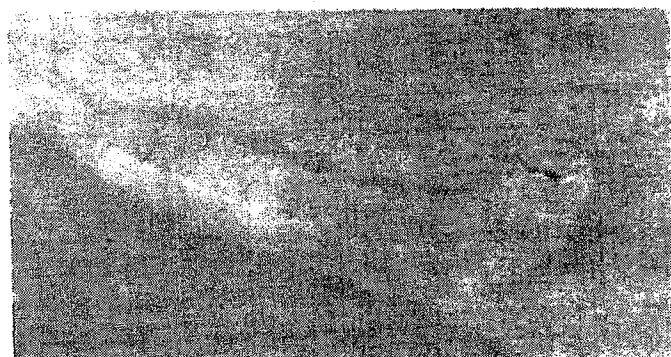
Fig. 2. Larvă

Simptome: ponta este depusă pe partea inferioară a frunzelor. Larvele atacă toate părțile aeriene ale plantelor de tomate și pot produce pagube în toate stadiile de dezvoltare ale plantelor. Acestea produc prin hrănire mine neregulate care în stadiu avansat de atac devin necrotice. Galeria produse în tulpină influențează negativ dezvoltarea plantelor. Fructele pot fi atacate încă de la apariție și galeriile formate pot fi invadate ulterior de patogeni secundari.